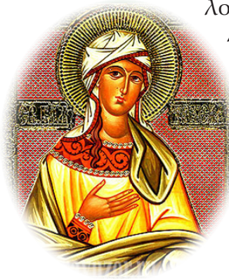
Ἡ Ἁγία Ταῖσία.

λοντος καὶ ἀνθρώπου ἐπιτρέποντος, ἡ λαμπρὴ ἀφετηρία γιὰ μιὰ καινὴ ἐν Χριστῷ Ἰησοῦ ζωὴ.