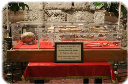
Ὁ Τάφος τοῦ Ἁγίου Ἀντιόχου.