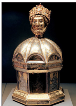
Ἴερά Λείψανα τοῦ Ὁσίου Ὁσουάλδου.

Τὸ σῶμα του μετεφέρθη στὸν Πέντα, ὁ ὁποῖος προσέταξε νὰ κόψουν τὸ κεφάλι καὶ τὰ χέρια του Ἀγίου καὶ νὰ τὰ στηλιτεύσουν ἐπάνω σὲ πασσάλους.