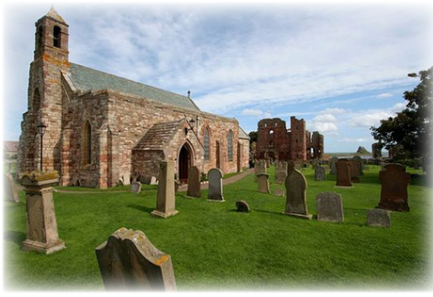
Ναὸς τῆς Παναγίας στὸ νησί Λίντισφαρν.

Π ερικυκλωμένος ἀπὸ ἐχθροὺς καὶ τρυπημένος ἀπὸ βέλη ἔπεσε ἔχων στὰ χεῖλη τὴν προσευχὴ αὐτή: «Θεέ μου, σῶσον τὰς ψυχάς!».