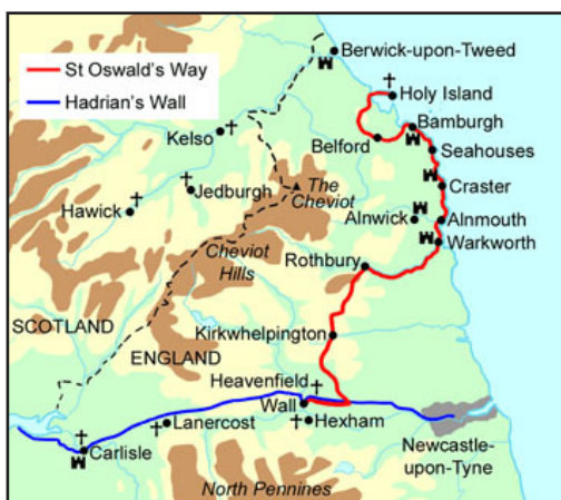
Τὸ ὁδοιπορικὸ τοῦ Ὁσίου Ὁσουάλδου.

Τῷ δὲ ἐν Τριάδι Παναγίῳ Θεῷ, τῷ ἐνδοξαζομένῳ ἐν τοῖς Ἀγίοις Αὐτοῦ, προσκύνησις καὶ εὐχαριστία, εἰς τοὺς αἰῶνας τῶν αἰώνων. Ἀμήν!