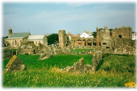
Ἐρείπια τῆς Μονῆς στὸ νησί Λίντισφαρν.