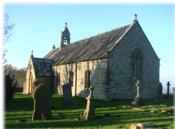
Ναὸς τοῦ Ὁσίου Ὁσουάλδου στὸ «Πεδίον τοῦ Οὐρανοῦ».