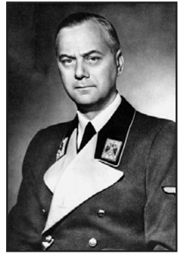
Άλφρεντ Ρόζενμπεργκ (1893-1946).