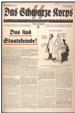
«Das Schwarze Korps» έφημερίδα τών SS.

Οί Γερμανοί, πήραν άκόμη κάθε μέτρο προφύλαξης για νά διασφαλίσουν ότι θά έπαυε ν' άναμειγνύεται τó αίμα τών Έβραίων μέ τó αίμα άλλων λαών.