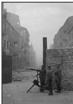
Βαρσοβία, 1η Αύγουστου 1944 (ἀριστερά). Ναζι φρουροί με πολυβόλο Maschinengewehr 08 σὲ μία ἀπὸ τὶς πύλες τοῦ γκέτο (δεξιά).

ων, ἀνδρῶν καὶ γυναικόπαιδων καὶ ἡ καταστροφή τῶν σπιτιῶν τους;