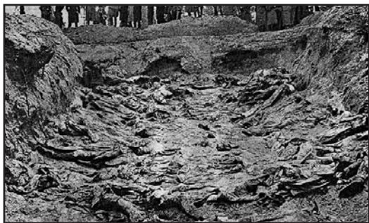
“Ένας από τους μαζικούς τάφους της Σφαγής του Κατίν.

ση τῶν Γερμανῶν, κατὰ τέτοιο τρόπο πού οἱ ἴδιοι οἱ Γερμανοὶ δὲν φάνηκαν νὰ ἔχουν ἄμεση σχέση με αὐτὰ τὰ γεγονότα.