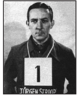
Γιούργκεν Στρόοπ (1895-1941).

καθάρματα ούτε όλους τους Εβραίους μέσα σ' ένα μόνο χρόνο, αλλά όσο περνάει ο καιρός, θα φτάσω σ' αυτόν τον στόχο».