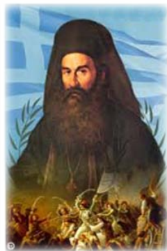
Παλαιῶν Πατρῶν Γερμανός.

- Ἀπὸ τίς ἄλλες περιοχὲς (Θεσσαλία, Ἥπειρο, Μακεδονία, Θράκη, Μ. Ἀσία) συμ-