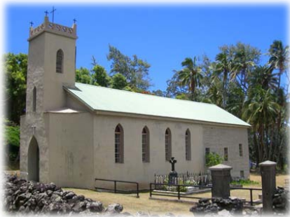
Τὸ μνημεῖο τοῦ ἡρωικοῦ ἱεραποστόλου.

Παρ' ὅλα αὐτὰ ἐξακολούθησε νὰ ἐργάζεται, νὰ κηρύττει, νὰ χτίζει, νὰ γιατρεύει... Ἔως ὅτου ἡ λέπρα, ρίχνοντας τὸ τελευταῖο της ἀτού, τὸν ξάπλωσε στὸ κρεβάτι γιὰ νὰ μὴ σηκωθεῖ πιά. Ἡ λέπρα εἶχε προσβάλει τὰ χρησιμότερα ὄργανα, τὰ πνευμόνια, τὸ στομάχι. Τὰ μάτια του δὲν ἔβλεπαν πιά τὸ φῶς τῆς ἡμέρας.