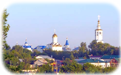
Ὁ Ναὸς τῆς Κοιμήσεως τῆς Θεοτόκου στὴν Ἱερὰς Μονὴ Ζιλάντωφ στὸ Καζάν.

Ἔτσι , τὸν Αὐγουστο τοῦ ἰδίου ἔτους εἶχαν ἀπομείνει μόνον 7 Μοναχοὶ καὶ 4 Δόκιμοι.