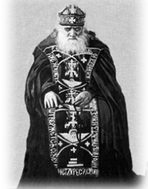
Ὁ Στάρετς Ἰωνᾶς τοῦ Κιέβου († 9.1.1902).

Μόλις τὸ ἄκουσα, ἔνιωσα καὶ ἐγὼ ρίγος ἀπὸ τὸν φόβο, φόρεσα γρήγορα τὸ ζωστικὸ καὶ τὸν σκουῖφο, εἶπα μία φορὰ τὸ «Ἄξιόν ἐστι» κι ἔκανα μετάνοια. «Δόξα» καὶ «νῦν», «Κύριε, ἐλέ-