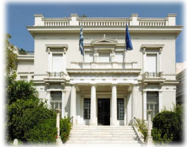
Τὸ Μουσεῖο Μπενάκη.

Ἐ πιπλέον, Ἄντωνης Μπενάκης (ἀδελφὸς τῆς Πηνελόπης Δέλτα), βιομήχανος, πολιτικὸς καὶ ἰδρυτὴς τοῦ Μουσείου Μπενάκη, πολέμησε κατὰ τὸ «Μαῦρο '97», ἐνῶ ἐνίσχυσε τὸν Μακεδονικὸ Ἀγῶνα καὶ προσέφερε ἐθελοντικὰ τὶς ὑπηρεσίες του στοὺς Βαλκανικοὺς Πολέμους. Δ ιοίκησε τὸν οἰκογενειακὸ ἐμπορικὸ οἶκο ὡς τὸ 1926 καὶ διακρίθηκε γιὰ τὸ φιλανθρωπικὸ του ἔργο. Τ ὸ Μουσεῖο Μπενάκη, ὄνειρο ζωῆς του, ἀνοίξε τὶς πόρτες του στὸ κοινὸ στὶς 22 Ἀπριλίου τοῦ 1931. Ἐ κεῖνος πέθανε τὸ 1954.