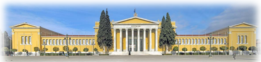
Τὸ Ζάππειον Μέγαρο.