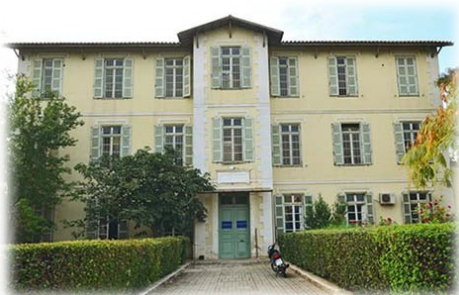
Τὸ Δρομοκαΐτειο Θεραπευτήριο.