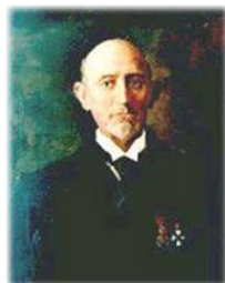
Τὸ Χαροκόπειο Πανεπιστήμιο καὶ ὁ Παναγὴς Χαροκόπος.

Τ ὸ σπουδαιότερο δημιούργημά του ὑπῆρξε ἡ Χαροκόπειος Οἰκοκυρική καὶ Ἑπαγγελματική Σχολὴ Θελέων, γιὰ τὴν ἴδρυση καὶ χρηματοδότηση τῆς ὁποίας μερίμνησε μὲ τὴν Διαθήκη του. Ἡ Σχολὴ αὐτὴ ἀπετέλεσε πρόδρομο τοῦ σημερινοῦ Χαροκοπεῖου Πανεπιστημίου.