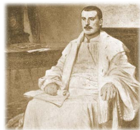
Ὁ ἐξ Ἑπείρου Εὐεργέτης Ζωσιμᾶς. Πίνακας τοῦ Νικηφόρου Λύτρα.