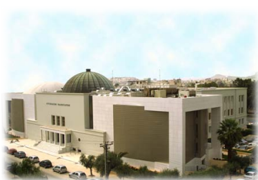
Τὸ Ἴδρυμα Εὐγενίδου, (ἀπὸ τὴν εἴσοδο τοῦ Πλανηταρίου).

Ἔ χασε τὴν περιουσία του καὶ τὴν ξαναδημιούργησε, κτίζοντας βαριὰ βιομηχανία –μὲ τὰ ἀποθέματα πυρομαχικῶν τῆς ΠΥΡΚΑΛ νὰ κρατοῦν τὸν ἑλληνικὸ στρατό– ὁ ὁποῖος δὲν εἶχε ἐπαρκῆ ἀποθέματα –κατὰ τὸν ἑλληνοϊταλικὸ πόλεμο. Μ ετὰ τὴν γερμανικὴ εἰσβολὴ ἐγκατέλειψε τὴν χῶρα καὶ μεταπολεμικὰ ἀσχολήθηκε