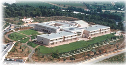
Τὸ Λάτσειο Διδασκῆριο (Ψυχικό, ἔπάνω). Τὸ Λάτσειο Δημοτικὸ Μέγαρο (Πύργος, δεξιά).

Έφοπλιστής με φιλανθρωπική δράση, πού περιλαμβάνει την ίδρυση του Ίδρυματος Ύποτροφιῶν Ι.Σ. Λάτσης καὶ τὸ 1990 τοῦ Ίδρυματος Ἀποκαταστάσεως Ὁμογενῶν ἐξ Ἀλβανίας. Μ ὲ δικά του χρήματα ἀνέγειρε τὸ Λάτσειο Κολλέγιο. Μ ὲ δικά του ἔξοδα ἀναπαλαίωσε τὸ Θέατρο Ἀπόλλων στὸν Πύργο, ἐνῶ ἐπίσης μὲ δικά του ἔξοδα ἔκτισε τὸ Λάτσειο Δημοτικὸ Μέγαρο στὴν ἴδια πόλη.