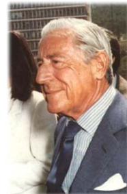
Τὸ Ἴδρυμα «Σταῦρος Νιάρχος» καὶ ὁ Σταῦρος Νιάρχος.