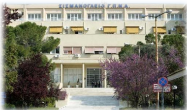
Τὸ Σισμανόγλειο Νοσοκομεῖο.

Ἐ πιπλέον, Ἰωάννης ἐπιχειρηματίας καὶ Εὐεργέτης, διέπρεψε στὸ ἐμπόριο στὴν Κωνσταντινούπολη. Ἐ νίσχυσε οἰκονομικὰ τὴν «Ἐπιτροπὴ τῆς Ἑλληνικῆς Ὀρθοδόξου Κοινότητος» τῆς Ἀγκυρας καὶ μὲ δικά του χρήματα ἰδρύθηκε τὸ πρῶτο ἑλληνικὸ δημοτικὸ σχολεῖο στὴν πόλη. Ἐ πίσης ἐνίσχυσε οἰκονομικὰ τὴν Ἑλληνικὴ Κοινότητα Κωνσταντινουπόλεως καὶ ἔκανε μεγάλη δωρεὰ γιὰ τὴν ἀνίδρυση τῆς Μεγάλης τοῦ Γένους Σχολῆς.