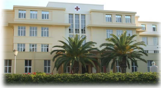
Τὸ Κοργιαλένιο-Μπενάκειο Νοσοκομείο.