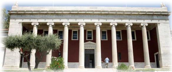
Ἡ Γεννάδειος Βιβλιοθήκη.