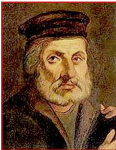
Ίανδος Λάσκαρις. (1445-1535)

8. Ο φιλελληνισμός, το υπέροχο αυτό κίνημα των ήθικα αισθαντικών Ευρωπαίων και Άμερικανών, έξηγιείται μόνο από την