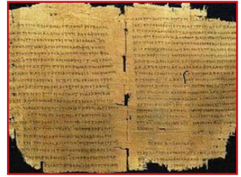
Από το Μοναστήρι της Πάτμου. Σιναιτικός Κώδικας με ελληνική γραφή.

3. Ο Ίανδος Λάσκαρις και άλλοι Έλληνες λόγιοι στην Ίταλία, πολύ πριν από τον 19ο αιώνα, όχι μόνο διδάσκουν τα κείμενα των αρχαίων Έλλήνων, αλλά και με αμείωτο ζήλο επιδιώκουν να προκαλέσουν πολεμική επιχείρηση των Δυτικοευρωπαίων για την απελευθέρωση των συγχρόνων τους Έλλήνων.