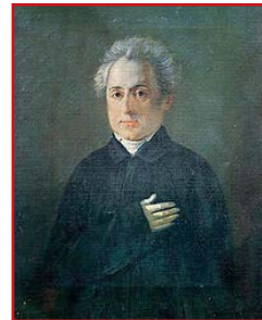
Διονύσιος Σολωμός. (1798-1857)