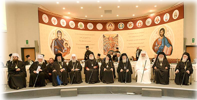
Ἡ «Ἁγία καὶ Μεγάλῃ Σύνοδος» τῶν Οἰκουμενιστῶν. (Κρήτη, 17-26.6.2016)

«Υπάρχει κάτι ἀνώτερον, τὸ ὁποῖο ἐντόπιζε ὁ συνοδικὸς νοῦς τῆς Ἐκκλησίας, καὶ τὸ ὁποῖο ἔδωσε τὴν δυνατότητα νὰ τεθῆ χωρὶς φόβο παράλληλα μὲ τὴν ὁμολογία τῆς πίστεως εἰς τὴν μίαν σώζουσα Ἐκκλησίαν καὶ τὴν πίστι στὸ ἓνα Βάπτισμα, σύμφωνα μὲ τὴν ἐντολὴ τοῦ Κυρίου, παρὰ τὸ ὅτι ἔχει τελεσθῆ τὸ βάπτισμα ἐκτὸς Ἐκκλησίας» 97 .