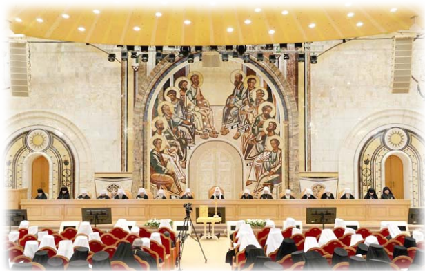
Ἡ Σύνοδος τῶν Ἀρχιερέων τῆς Ρωσικῆς Ἐκκλησίας. (Μόσχα, 2-3.2.2016)

«Υπήρχαν μάλιστα καιροί, κατά τὸν ΙΗ΄ αἰῶνα, ὅπου ὁποιοσδήποτε λόγος ὑπερασπίσεως τῆς Ὁρθοδοξίας ἢ ἐλέγχου τῶν δυτικῶν αἱρέσεων, ἐθεωρεῖτο ὡς πολιτικὸ ἐγκλημα, ὡς προσβολὴ τῆς κυβερνήσεως... Μ ερικοὶ Ἐπίσκοποι ἔχασαν τὶς καθέδρες τους καὶ ἐφυλακίσθησαν, διότι ἐκτύπωναν καὶ διέδιδαν τὴν “Πέτρα τῆς Πίστεως” τοῦ Στεφάνου Ἰαβόρσκου, αὐτὸ τὸ ἐκτενὲς πολεμικὸ ἔργο ἐναντίον τῶν Προτεσταντῶν... Τ ὸν ΙΗ΄ αἰῶνα, ἐξ αἰτίας τῆς πλήρους κυριαρχίας τῶν Μικρορώσων στὴν Ἀκαδημία, ἐπεκράτησε ἡ σχολαστικὴ δυτικὴ θεολογία... Ὅ λοι οἱ μελλοντικοὶ ποιμένες τοῦ ρωσικοῦ λαοῦ, ὅλοι οἱ μελλοντικοὶ θεολόγοι ἄρχισαν νὰ ὀμιλοῦν στὰ λατινικά» 81 .