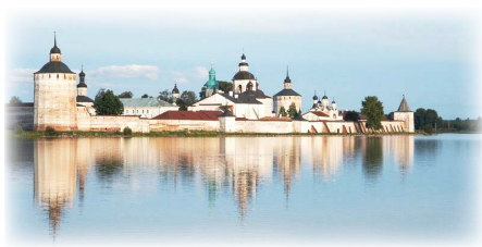
Ἰερά Μονή Ὁσίου Κυρίλλου. Λευκή Λίμνη.

τευτες. Ἐ , αὐτοὺς νὰ σκεφτῆς τώρα. Γ ύρισε πίσω στὴν Μόσχα καὶ κάθισε νὰ σκεφτῆς πῶς θὰ ἐλαφρώσης τὸν πόνο τους.