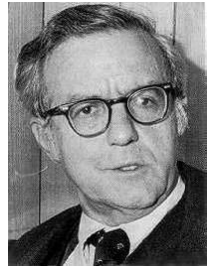
Ἰαν Στήβενσον. (1918-2007)