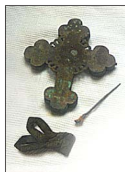
Ὁ Σταυρὸς καὶ τὸ καρφί εὑρέθησαν στὸ φέρετρο τοῦ π. Κωνσταντῖνου.

Ἄ ν καὶ ὁ π. Κωνσταντῖνος ἦταν ἀρκετὰ δυνατὸς καὶ θὰ μποροῦσε τουλάχιστον νὰ ἀντισταθῆ, ἐν τούτοις ἐπέλεξε νὰ ὑπομείνῃ ἕως τέλους τὸ μαρτύριο.