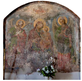
Παναγία Θυμανὴ. Χανιά Κρήτης.

«Οἱ καπετάνιοι σύραν ἀπὸ τὸν κόρφο τους τὶς σημαῖες τους ... Εἶταν ὅλες κόσκινο ἀπὸ τὰ βόλια κι ἀθαλωμένες στὸν καπνὸ τοῦ μπαρουτιοῦ. Ἡ μιὰ εἶχε στορισμένο στὸ πανὶ τὸν Ἄη Γιώργη, ἡ ἄλλη τὸν Ἀηστράτηγο τὴν Παναγιά. Βρέθηκε καὶ μιὰ ἑλληνικὴ μὲ τὸν σταυρὸ κι ἓνας λεβέντης τὴν ἰσάρισε στὸ δῶμα ἐνδὸς χαμόσπιτου».