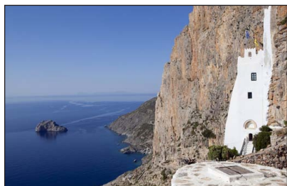
Παναγία ἡ Χοζοβιώτισσα. Ἀμοργός.

Ἄ ν ὑπάρχει νησὶ στὴν Ἑλλάδα ποὺ νὰ μὴν τιμᾷ τὴν Παναγία μὲ ἓναν τουλάχιστον Ναὸ ἀφιερωμένο σ' Αὐτήν. Σ τὴν Τήνο τιμᾶται ἡ Εὐαγγελίστρια. Σ τὴν Εὐβοία ἡ Παραβουνιώτισσα. Σ τὴν Πάρο ἡ Ἑκατονταφυλιανή. Σ τὴν Ἀμοργὸ ἡ Χοζοβιώτισσα. Σ τὴν Ζάκυνθο ἡ Ἀναφωνήτρια. Σ τὴν Σκιάθο ἡ Εἰκονίστρια. Σ τὴν Σκόπελο ἡ Ἐλευθερώτρια. Σ τὴν Κύνθο ἡ Κανάλα. Σ τὴν Σάμο ἡ Σαραντασκαλιώτισσα. Σ τὴν Ἄνδρο ἡ Θαλασσινή. Σ τὴν Ἴο ἡ Γκρεμιώτισσα. Σ τὴν Κεφαλληνία ἡ Φιδιώτισσα. Σ τὴν Νάξο ἡ Καταπολιανή. Σ τὰ Κύθηρα ἡ Μυρτιδιώτισσα. Σ τὴν Κέρκυρα ἡ Κρασοπωλίτισσα