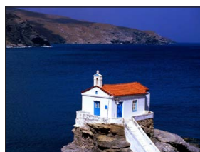
Παναγία ἡ Θαλασσινή. Ἄνδρος.

(κτισμένη στὸν Οἰκισμὸ τῶν οἰνοποιῶν). Σ τὴν Χίο ἡ Ἀγιογιαλοῦσα. Σ τὴν Λέρο ἡ Καστριώτισσα. Σ τὴν Λέσβο ἡ Ἀγιασώτισσα. Σ τὴν Κύπρο ἡ Κύκκου. Σ τὴν Κρήτη ἡ Παναγία τῶν Σταυροφόρων (κτίστηκε ἀπὸ τοὺς σταυροφόρους τὸν 13ο αἰῶνα, ὡς Παναγία τῶν Ἀγγέλων, ἐγινε τζαμι ἀπὸ τοὺς Τούρκους, τὸ 1669,