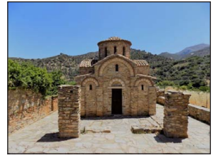
Παναγία Φοδελιανή. Φόδελε Κρήτης.

βομβαρδίστηκε από τους Γερμανούς τὸ 1941 καὶ ἀναστηλώθηκε τὸ 1965), ἡ Παναγία ἡ Φοδελιανή (στὸ χωριὸ Φόδελε [τόπος γέννησης τοῦ Δομίνικου Θεοτοκόπουλου]) καὶ ἡ Παναγία ἡ Ἀκρωτηριανή (Μονὴ Τοπλοῦ, στὸ Λασιῖθι) κ.λπ.