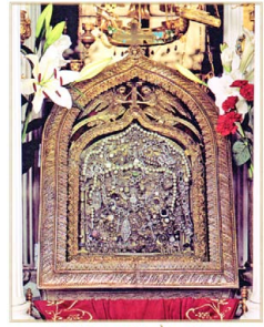
Ἡ ΜΕΓΑΛΟΧΑΡΗΣ ΤῆΣ ΠΑΤΡΑΣ

πλατεία Ἁγίου Γεωργίου τῆς Πάτρας, τὴν 24η Μαρτίου. Ἐν τούτοις, ἐπειδὴ οἱ πρωταγωνιστὲς τῆς Ἐπανάστασης στὴν Πελοπόννησο εἶχαν ἀποφασίσει, γιὰ λόγους ἐθνικοθρησκευτικοῦ συμβολισμοῦ, νὰ ξεκινήσουν τὸ τουφεκίδι κατὰ τοῦ Τούρκου δυνάστη, τὴν ἡμέρα τοῦ Εὐαγγελισμοῦ, οἱ ἄμεσοι ἀπόγονοί τους ἱκανοποίησαν τὴν ἐπιθυμία τους αὐτὴ καὶ ὄρισαν τὴν 25η Μαρτίου ἡμέρα ἑορτασμοῦ τῆς Ἐθνεγερσίας.