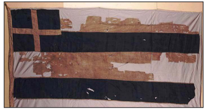
Ἡ ἐπαναστατικὴ σημαία τοῦ πυρπολίτου Κωνσταντίνου Κανάρη.

Πέρα τούτου, όμως, είναι επίσης γνωστό σὲ ὅλους, ὅτι ἡ κήρυξις τοῦ Ἀγῶνος ἀπὸ τὸν Ἀρχηγὸ τῆς Ἐπαναστάσεως Στρατηγὸ Ἀλέξανδρο Κωνσταντίνου Ὑψηλάντη ἔγινε διὰ τῆς Προκηρύξεως τῆς 23ης Φεβρουαρίου 1821, ποῦ εἶναι γνωστὴ ὡς « Μάχου ὑπὲρ πίστεως καὶ πατρίδος », ἐκ τοῦ ρητοῦ τῆς προμετωπίδος της.