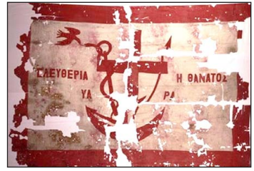
Ἡ ἐπαναστατικὴ σημαία τῶν Ὑδραίων.