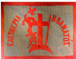
Ἡ ἐπαναστατικὴ σημαία τῶν Σπετσῶν.