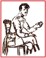
Ὁ Ταγματάρχης Ἀράμ Καϊζάκ σὲ σκίτσο τῆς ἐποχῆς.

Ἔτσι ἄρχιζε ἡ ἀποκατάστασις ἐνὸς μικροῦ ἀριθμοῦ προσφύγων πὸν ξέφυγαν ἀπὸ τὸ μένος τῶν Τούρκων σφαγέων.