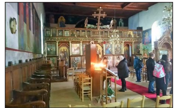
Ὁ σημερινὸς Ἱερὸς Ναὸς τοῦ Εὐαγγελισμοῦ τῆς Θεοτόκου τῆς Ἐκκλησίας μας στὴν Κέρτεζη Καλαβρύτων.

Ὅτε δὲ συνηθοίσθη ὁλος ὁ λαὸς ἐκτὸς καὶ ἐντὸς τοῦ ἱεροῦ Ναοῦ τοῦ ἐξωκκλησίου ἦσαν πτον κηρία ἀσπαζόμενοι καὶ σταυρο-