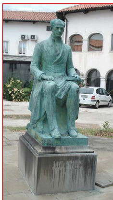
Ανδριάντας Ιωάννου Καποδίστρια.

Έργον Κωνσταντίνου Παλαιολόγου, 2001. Πλατεία Ι. Καπο- δίστρια, Κόπερ, Σλοβενία.