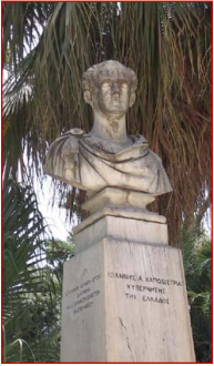
Προτομή του Ίωάννου Κα- ποδίστρια. Έργον Ίωάννου Κόσσου, 1866. Έθνικος Κήπος.

Η αποκαρδιωτική εικόνα που αντίκρισε αποτυπώνεται στα λόγια του: