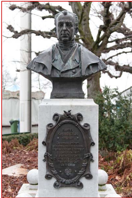
Προτομή Ἰωάννου Καποδίστρια.

Ἔργον Βιάτσεςλαβ Κλύκωβ (Vjacheslav Klykov), 2003. Ἅγια Πετρούπολη, Ρωσία.