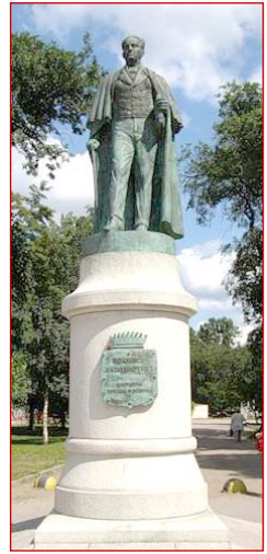
Ἀνδριάντας Ἰωάννου Καποδίστρια.

Α πό τις ιστορικές μαρτυρίες, πουθενά δεν φαίνεται ότι κυβέρνησε την Ελλάδα δικτατορικά. Ο ύτε άρπαξε την εξουσία με την βία, ούτε ο λαός τον απέρριψε· απεναντίας, απέθεσε σε αυτόν τις ελπίδες του για την απαλλαγή του από την καχεξία και την οθωμανική δουλεία. Υ πήρξε πράγματι « εὐφροσύνη τοῦ λαοῦ, μελαγχολία μερικῶν προκρίτων ἀριστοκρατῶν », όπως μαρτυρεῖ ὁ ἱστορικός Νικόλαος Κασομούλης.