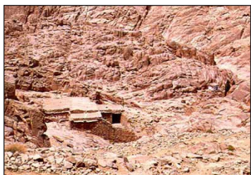
Σπήλαιο-Παρεκκλήσιο Προφήτου Ἡλίου.

πού ἀπέχει ἀπὸ τὴν Μονὴ Σινᾶ δύο ὥρες, μὲ περίπου 3.700 σκαλοπάτια.