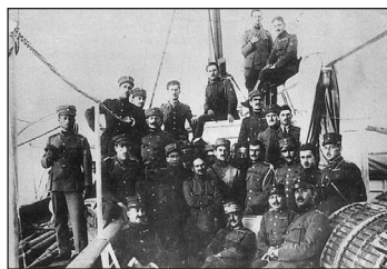
Ό Ύποστράτηγος Κωνσταντίνος Μαζαράκης - Αινιάν και το έπιτελείο του στο κατάστρωμα του όπλαγωγού «Μυκάλη» έν πλώ προς το λιμάνι του Δεδεαγ'ατς (μετέπειτα Αλεξανδρούπολης).

Ε ιδικότερα για την Δυτική Θράκη, η Συνθήκη μεταβίβαζε στην Ελλάδα τα δικαιώματα που η Βουλγαρία είχε έκχωρήσει στους Συμμάχους με την Συνθήκη του Νειγι τον Νοέμβριο 1919. □