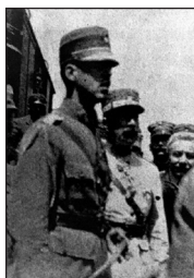
18.7.1920. Ο Βασιλέας Αλέξανδρος επισκέπτεται τὸ Διοικητήριο Κομοτηνῆς.

λοῦσε ἤδη ὑπὸ ἑλληνικὸ στρατιωτικὸ ἔλεγχο ἀπὸ τὸν προηγούμενο Ὀκτώβριο.