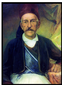
Μπενιζέλος Ρουφος. (1795-1868)