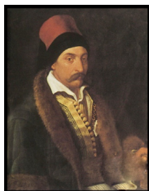
Άνδρέας Ζαΐμης. (1791-1840)