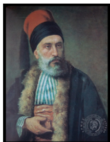
Άσημάκης Φωτή- λας. (1761-1835)