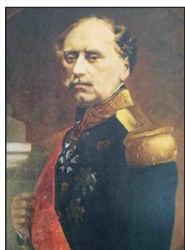
Δημήτριος Καλλέργης. (1803-1867)