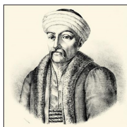
Παναγιώτης (Πα- νουῦτσος) Νοταρᾶς. (1752-1849)

τοὺς στρατιωτῆς τοὺς καὶ ἐφρόντιζαν νὰ τοὺς ὀχυρῶνουν σὲ ἰσχυρὲς θέσεις (ταμπούρια). Α πέφευγαν νὰ πολεμοῦν σὲ πεδινὰ ἐδάφη, ὅπου τὸ ὀθωμανικὸ ἵππικὸ ἦταν ἀνίκητο· ἐπίσης, ἐγνώριζαν νὰ χειρίζονται μὲ τὸν δικό τους ξεχωριστὸ τρόπο τὰ ζητήματα τῆς ἀνυπακοῆς τῶν στρατιωτῶν τους.