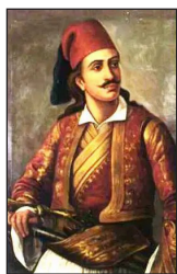
Ἰωάννης Νοταρᾶς. (1805-1827)