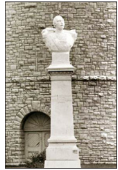
Ἡ προτομὴ τοῦ Δ. Ὑψηλάντου στὴν πρόσοψη τοῦ ὕδατοπύργου στὸ Ὑψηλάντι, Μίσιγκαν Η.Π.Α.