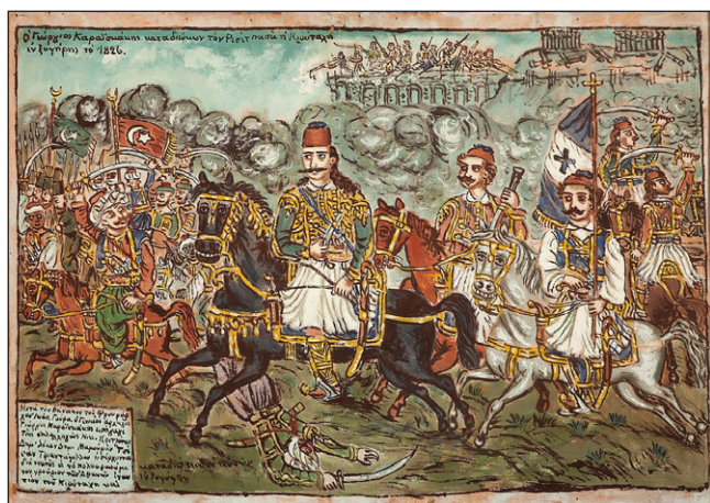
Ὁ Γεώργιος Καραϊσκάκης καταδιώκων τὸν Ρεσίτ Πασᾶ ἢ Κιουταχῆ ἐν ξιφῆρεις τὸ 1826. Χωρὶς χρονολογία. Ἔργο τοῦ Θεοφίλου.

Ὁ Καραϊσκάκης, ἔχοντας ἤδη ἀπελευθερώσει τὸ μεγαλύτερο μέρος τῆς Ρούμελης, μὲ λαμπρότερο παράδειγμα τὴν ἐπική Μάχη τῆς Ἀράχωβας (18-24 Νοεμβρίου 1826), εἶχε διαισθανθῆ ὅτι τυχὸν πτώσις τοῦ «Κάστρου τῆς Ἀθήνας» θὰ εἶχε δυσμενεῖς ἐπιπτώσεις στὴν πορεία τῆς Ἐπανάστασεως, ἡ ὁποία εὐρισκόταν ἤδη σὲ κρίσιμο σημεῖο μετὰ τὴν πτῶσι τοῦ Μεσολογγίου (10 Ἀπριλίου 1826) καὶ τὶς ἐπιτυχίες τοῦ Ἱμπραήμ στὴν Πελοπόννησο.