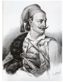
Κίτσος Τζβέλλας. Λιθογραφία. Κάρλ Κράτσοαίξεν.

Μ ετά την απόσυρσή του από τὸ στρατό, ἀναδείχθηκε σὲ ἀρχηγὸ τοῦ Γαλλικοῦ κόμματος. Ἐκλέχθηκε ἀντιπρόσωπος στὴν Α΄ Ἐθνοσυνέλευση ποὺ προέκυψε μετὰ τὴν ἐπανάσταση τῆς 3ης Σεπτεμβρίου 1843 γιὰ τὴν παραχώρηση Συντάγματος.