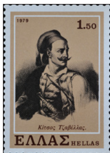
Κίτσος Τζαβέλλας. Γραμματόσημο, 1979.

ἀναμίχθηκε στις συγκρούσεις που ἀκολούθησαν.