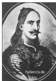
Φώτος Τζαβέλλας. (1770-1809)