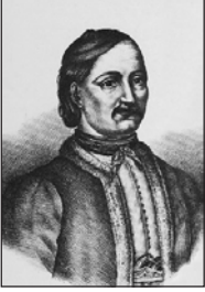
Ιωάννης Κωλέττης (1787 ή 1788 - 1847).

Σ την συνέχεια συνεργάστηκε με τον Γεώργιο Καραϊσκάκη και διακρίθηκε στην Μάχη της Άμπλιανης (14 Ιουλίου 1824), στο δρόμο Σαλώνων-Γραβιάς, όπου έπωφελούμενος την δυσχερή θέση του έχθρου, έπιτέθηκε την στιγμή που έπρεπε με τους άνδρες του και ανάγκασε τους Όθωμανούς σε άτακτο φυγή: οί Τούρκοι είχαν περισσότερους από 2.000 νεκρούς.