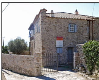
Οικία Λάμπρου Τζαβέλλα.