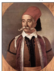
Προσωπογραφία τοῦ Πετρόμπεη Μαυρομιχάλη. Ἀθήνα, Ἐθνικὸ Ἱστορικὸ Μουσεῖο.

Ἡ πρώτη, ἀπὸ τοὺς ἀρχηγούς τῆς Ἀνατολικῆς Μάνης ὑπὸ τοὺς Γρηγοράκηδες, πρὸς τὴν Μονεμβασιά καὶ τὸ Μυστρά, τὸ ἀπόγευμα τοῦ Σαββάτου 19 Μαρτίου, ὅπως πιστοποιεῖται ἀπὸ ἐπιστολὴ τοῦ Πρωτοσύγκελλου Γεράσιμου πρὸς τὸν Παναγιώτη Κοσονᾶκο, ὅπου γνωστοποιεῖται ἡ ἔναρξη τοῦ πολέμου καὶ μεταφέρεται ἡ προτροπὴ γιὰ τὴν διάδοση τῆς εἰδησης. Οἱ ἀρ-