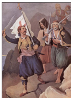
Ο Πετρόμπεης Μανρομιάλης έπαναστατεί τη Μεσσηνια. Παρίσι, Έθνικη Βιβλιοθήκη.

Όπως φαίνεται από έγγραφα που σώζονται σε αρχεία επιφανών οικογενειών της Μάνης, στις αρχές Μαρτίου, όλοι οί καπεταναίοι επικοινωνούσαν μεταξύ τους και με τον Πετρόμπεη είτε με κρυπτογραφημένες έπιστολές ή με προσωπικές επαφές, με σκοπό την συνεννόηση για την προετοιμασία και τον κοινό τρόπο δράσης. Γύρω στα μέσα Μαρτίου, οί τελικές αποφάσεις φαίνεται ότι είχαν ήδη ληφθεί, καθώς οί συναντήσεις και οί ανταλλαγές έπιστολών διακόπηκαν έντελώς. Οί άρχηγοί είχαν πιά άφοσιωθεί άποκλειστικά στην προετοιμασία των δυνάμεών τους.