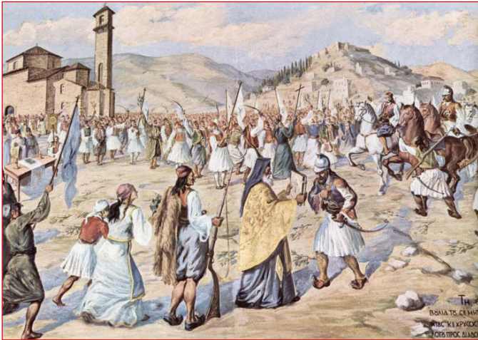
Ἀναπαράσταση τῆς Δοξολογίας τῆς 23ῆς Μαρτίου 1821 στὴν Καλαμάτα. Καλαμάτα, Μπενάκειο Μουσεῖο.

(*) Δρ. Πηγὴ Π. Καλογεράκου. ἱστορικοῦ-Ἀρχαιολόγου. Πηγὴ: https://www.sansimera.gr • Ἐπιμέλ. ἡμετ.