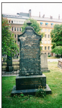
Ὁ τάφος τοῦ Αὐγούστου Μαξιμιλιανοῦ Μύρμπεργκ στὴν Στοκχόλμη.

πρὶν χρόνια στὸ πατρικὸ σπίτι τοῦ Μύρμπεργκ στὴν Φινλανδία, τὸν βοήθησε νὰ διαφύγει κρυφά. Κ αταπονημένος καὶ χωρὶς χρήματα κατέφυγε στὸ Παρίσι. Ἐ κεῖ, χάρις στὶς γνωριμίες του ἔπιασε δουλειὰ ὡς γραμματέας.