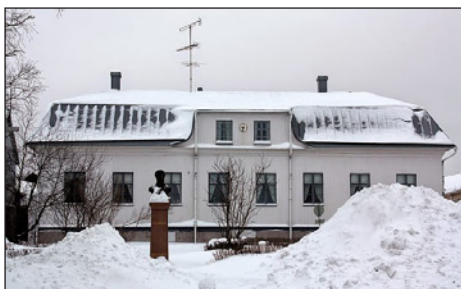
Ἡ οἰκία τῶν Μύρμπεργκ στὴν Φινλανδία. Μὲ τὴν προτομὴ τοῦ Αὐγούστου Μαξιμιλιανοῦ Μύρμπεργκ.

οἱ ἀγωνιστὲς εἶχαν πάντα μαζί τους μιὰ πιστόλα, γιὰ τέτοιες ἀπελπιστικὲς καταστάσεις γιὰτὶ οἱ Τοῦρκοι γιὰ κάθε κεφάλι ἐχθρικό, ἔπαιωναν ξεχωριστὴ γενναία ἀμοιβή!!! Τ ὸ πιστόλι αὐτὸ τὸ κρατοῦσε στὰ χέρια του, ὅταν ἄκουσε τὸν καλπασμὸ ἑνὸς ἀλόγου.