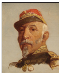
Αύγουστος Ρενό ντε Σέν-Ζαν ντ' Ανζελύ (1794-1870).

Α ργότερα βρέθηκε στο Παρίσι, τον χειμώνα του 1823. Έ κει ήρθε σε έπαφή με τα φιλελληνικά κομιτάτα και έτσι κατόρθωσε να έπιβιβασθει σε ένα πλοίο και να φτάσει στις άρχές του 1824 στο Ναύπλιο, όπου κατετάγη στο έλληνικό Ίππικό, που είχε όργανώσει ο γενναίος φιλέλληνας Αύγουστος Ρενό ντε Σέν-Ζαν ντ' Ανζελύ (Auguste Regnault de St Jean d' Angely), ό όποιος αργότερα άναδείχθηκε Στρατάρχης της Γαλλίας.