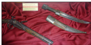
Τὸ μαχαίρι (τύπου jambiya) καὶ ἡ βραχύκανη πιστόλα μὲ εὐρωπαϊκὸ μηχανισμό πυρόλιθου τοῦ Ἀθανασίου Ραζηκότσικα.

« Η ταν πρῶτῃ, Σάββατο τοῦ Λαζάρου, 10 Ἀπριλίου τοῦ 1826, ὅταν συγκροτήθηκε τὸ νεκροδόξαστο ἐκεῖνο συμβούλιο ἀποφάσεως. Η ταν ἓνα συμβούλιο θανάτου. Οἱ καπεταναῖοι εἶχαν ἀναλάβει νὰ διερευνήσουν, μὲ ἀνιχνευτὲς τὴν ὑπαρξὴ μυστικοῦ δρόμου-διόδου γιὰ ἀκίνδυνο πέρασμα τῶν ἐλεύθερων Πολιορκημένων στὴν ἐλευθερία. Κ ανένας ὅμως δὲν ἔφερε ἐλπιδοφόρα πληροφορία. Οἱ λόγχοι καὶ οἱ στενωποὶ φυλάγονταν ἄγρυπνα ἀπὸ τοὺς πολιορκητὲς σὲ βάθος χώρου καὶ τόπου. Γ ενικὴ ἦταν ἡ κατῆφεια καὶ ἡ σιωπηλὴ θλίψη. Τ ὴν σιωπὴ τῆς στιγμῆς ἔσπασε ἡ βροντώδης καὶ σταθερὴ ἔκρηξη τοῦ τρανοδύναμου ἀρχηγοῦ τῆς Φρουρᾶς, τοῦ Θανάση Ραζη-Κότσικα.