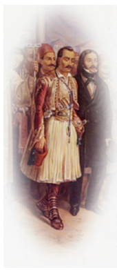
Ο Ἀθανάσιος Ραζηκότσικας πλάϊ στον Ἀλέξανδρο Μαυροκορδάτο.

Παράλληλα, σχεδίαζε μία ἀπροσπέλαστη ὀχύρωση γιὰ τὸ Μεσολόγγι. Ὁ ἴδιος μάλιστα ἀνέλαβε τὴν ἐπίβλεψη, τὸν συντονισμό, ἀλλὰ καὶ μεγάλο μέρος τῆς χρηματοδότησης τοῦ ἔργου. Οἱ κάτοικοι ἐπίσης συνέβαλαν μὲ ἐράνους καὶ ἐθελοντικὴ ἐργασία.