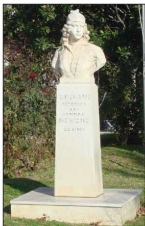
Προτομή Θεμιστοκλή Βισβίτη, Πλατεία Φάρου, Αλεξανδρούπολις.

λης τὴν ἀνάπτυξιν σου εἰς τὴν γαλλικὴν γενναιοδωρίαν. Ἴσως δὲν θὰ ζῶ, ὅταν ἐπιστρέψης. Σκέψου ὁμως, παιδί μου, ὅτι πρέπει νὰ μιμηθῆς καὶ νὰ ἐκδικήσῃς τὸν πατέρα σου».