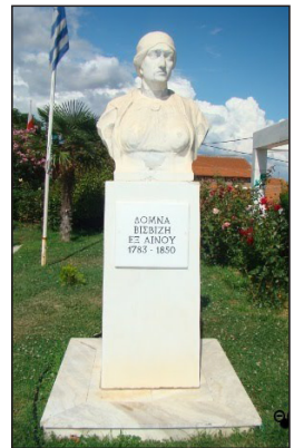
Προτομὴ Δόμνας Βισβίζη. Πλατεῖα Φάρου, Ἀλεξανδρούπολις.

Ἡ ὑπέροχη αὐτὴ ψυχὴ, ἡ ὁποῖα ἔδωσε τὸν σύζυγό της, τὸ καράβι της, ἄδειασε γενναιοδωρα τὴν γεμάτη χρυσὸ κασέλα της, ἀφιέρωσε τὴν ἱκμάδα τῆς νεότητός της ἀναζητώντας πατρίδα καὶ λευτεριά, καὶ ἄφησε ἔρημα σπίτια καὶ ἀκίνητα στὰ χέρια τοῦ