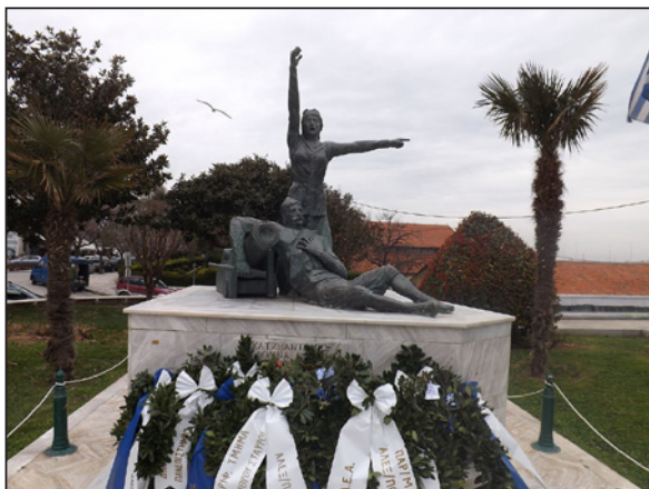
Μνημεῖο τῶν Δόμνα καὶ Χατζῆ-Ἀντώνη Βισβίτζη. Πλατεία Φάρου, Ἀλεξανδρούπολις.

• Ἐπιμέλ. ἡμετ.