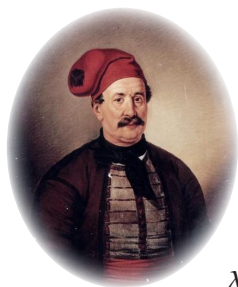
Δημήτριος Παπανικολής (1790-1855).