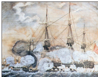
Ἡ Πυρπόληση τουρκικοῦ δίκροτου ἀπὸ τὸν Δημήτρη Παπανικολῆ.

Η τραγωδία τοῦ τουρκικοῦ δίκροτου κράτησε γύρω στὰ 35 λεπτά. Τ όσο χρειάστηκε γιὰ νὰ μεταβληθεῖ τὸ ἐπιβλητικὸ πλοῖο σὲ τέφρα