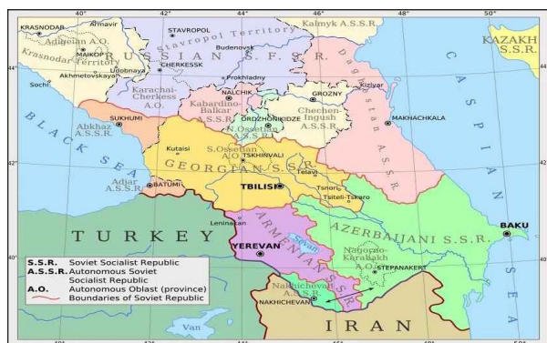
Χάρτης τοῦ Καυκάσου τὴν σοβιετικὴ περίοδο 1957-1991

Σὲ κάθε ἑλληνικὸ σπίτι, σὲ ὅλη τὴν παραλιακὴ γραμμὴ ἀπὸ τὴν Ἀνάπα στὴν περιοχὴ τοῦ Κράσονονταρ ἕως τὸ Σόχουμ τῆς Ἀμπχαζίας καὶ τὸ Βατοῦμ τῆς Ἀντζαρίας, μπῆκαν ἕνας ἀξιωματικὸς καὶ ἕνας στρατιώτης.