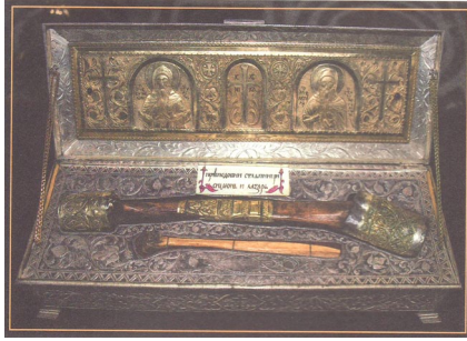
Τίμιο Λείψανο τοῦ Ὁσίου Λαζάρου. Τερά Μονῆ Χιλιανδαρίου Ἁγίου Ὄρους.