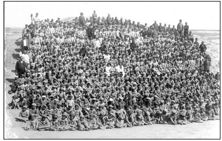
850 ὄρφανὰ στὸ Ἰράκ.

Α ποκαλύπτοντας τὸν κομβικὸ ρόλο τῆς «δημογραφικῆς μηχανικῆς» στὴν Γενοκτονία τῶν Ἀρμενίων, τὸ ἔργο αὐτὸ ἀποτελεῖ ἀνεκτίμητη συμβολὴ στὴν κατανόηση τοῦ ἐγκλήματος. Ἐ πιπρόσθετα, τὸ βιβλίον παρουσιάζει ἰδιαίτερο ἐνδιαφέρον γιὰ τὸν Ἑλληνα ἀναγνώστη, καθὼς ὁ Ἄκτσαμ ἀσχολεῖται ἐκτενῶς μὲ τὴν ἔξωση τῶν Ἑλλήνων τῶν παραλίων τῆς Μικρᾶς Ἀσίας ἀπὸ τὶς ἐστίες τοὺς τὴν περίοδο 1914-15, καταλήγοντας στὸ συμπέρασμα, ὅτι ἔτσι διαμορφώθηκε καὶ δοκιμάστηκε ὁ μηχανισμὸς πὺν χρησιμοποιήθηκε ἐν συνεχείᾳ σὲ πολὺ μεγαλύτερη κλίμακα στὴν Γενοκτονία τῶν Ἀρμενίων.