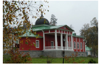
Ἡ Σκήτη τῆς Ὀπτινα.

Μετὰ τὴν Ἀκολουθία τοῦ Ὁρθρου, τὴν ὁποία διάβαζε μὲ τοὺς ὑποτακτικούς του στὸ Κελλί, ἀφιερωνόταν στὴν προσευχὴ γιὰ τρεῖς ὥρες· κατόπιν, ἀπὸ τὶς ἑννέα τὸ πρωῖ καὶ ὕστερα, ἄρχιζε νὰ βλέπη τοὺς ἐπισκέπτες, οἱ ὁποῖοι ἤδη σχημάτιζαν οὐρὰ ἔξω ἀπὸ τὸ Κελλί του, πρῶτα τοὺς Μοναχοὺς καὶ στὴν συνέχεια τοὺς λαϊκοὺς. Οἱ συνομιλίες του διαρκοῦσαν μέχρι τὶς ἑνδεκα τὸ βράδυ, μὲ μιὰ φευγαλέα διακοπὴ γιὰ ἓνα λιτὸ γεῦμα.