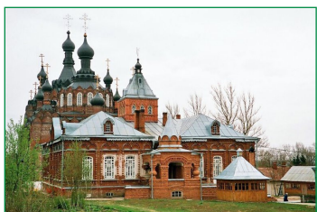
Ἡ Μονὴ Σαμορντῖνο.

τὴν ὀργάνωσι ἐνὸς γυναικείου Μοναστηριοῦ στὸ Σαμορντῖνο, δεκαπέντε περίπου χιλιόμετρα μακριὰ ἀπὸ τὴν Ὕπτινα.