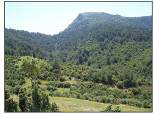
Τὸ Γαλήσιον Ὅρος.

Σ τηριχθέντες στήν εὐλογία καὶ εὐχή τοῦ Ἀειμνήστου Γέροντος, Πατρὸς καὶ Μητροπολίτου μας Κυπριανοῦ († 17.5.2013), ὡς καὶ τοῦ σεβαστοῦ Γέροντος καὶ Ἡγουμένου τῆς Ἱερᾶς Μονῆς μας Πανσοῦ. Ἀρχιμανδρίτου π. Θεοδοσίου, ὠλοκληρώσαμε τὸ ἔργον καὶ δοξάζουμε τὸν Πατέρα, τὸν Υἱὸν καὶ τὸ Ἅγιον Πνεῦμα, τὸν Κύριο καὶ Θεό μας.