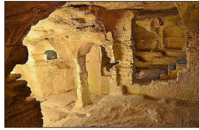
Ἡ Μονὴ Κονταδίσκου.