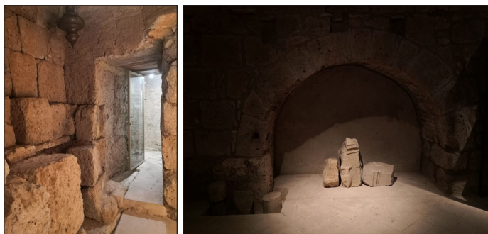
Ἡ ὑπόγεια κρύπτη, ὅπου φυλασσόταν τὸ Λεῖψανο τοῦ Ἁγίου Μένδικου. Ναὸς τοῦ Ὀτρίκολι.

Ἦ Πάπας Εὐγένιος Γ' στὴν πόλιν τοῦ Βιτέρμπο (Viterbo) στὶς 27 Φεβρουαρίου τοῦ 1148, ἐπιβεβαιώνει σύμφωνα μὲ τοὺς κανόνες τοῦ Ἁγίου Αὐγουστίνου, ὅπως καὶ ὁ Πάπας Ὀνώριος Γ' τὸ 1221, ὁ