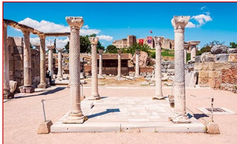
Ὁ τάφος τοῦ Ἁγίου Ἰωάννου Θεολόγου. Ἐφεσος.