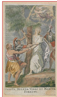
Πίνακας μὲ τὸ μαρτύριο τῆς Ἁγίας Ἀλῖνας.

Ἐνα βράδυ, ὁ πατέρας της εἶπε στοὺς φρουροὺς νὰ τὴν παρακολουθήσουν καὶ ἀφοῦ τὴν ἐντόπισαν, εἶδαν τὴν Ἀλῖνα νὰ εἰσέρχεται σὲ ἓνα Παρεκκλήσι στὸ Βὸρστ (Vorst). Τότε ὁ πατέρας της κατέληξε στὸ συμπέρασμα, ὅτι οἱ Χριστιανοὶ τῆς εἶχαν κάνει μάγια, προκειμένου νὰ τὴν μεταστρέψουν καὶ ἔδωσε ἐντολὴ νὰ τὴν συλλάβουν. Ἔτσι , ἔστειλε φρουροὺς νὰ τὴν φέρουν στὸ σπίτι.