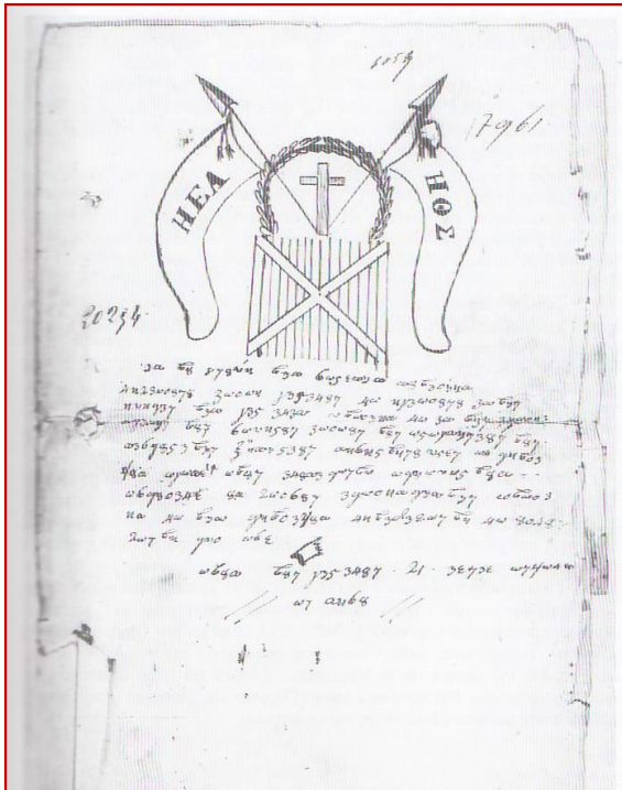
Ἐγγραφο τῆς Φιλικῆς Ἐταιρείας μὲ συνθηματικὴ γραφῆ. Βρέθηκε στὸν φάκελο τοῦ Ἐφέσιου ἀγωνιστῆ Βασιλείου Σαμαλάνογλου τοῦ Ἰωάννου.