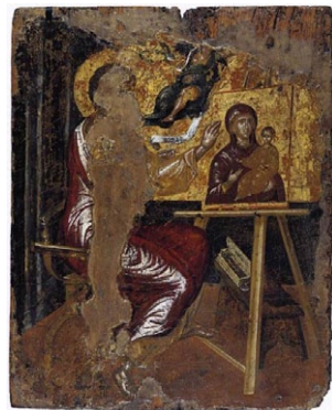
Ὁ Εὐαγγελιστὴς Λουκάς ζωγραφίζει τὴν Εἰκόνα τῆς Παναγίας, 1560-1567.