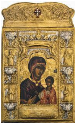
Παναγία Σουμελά. Ἔργον τοῦ Εὐαγγελιστοῦ Λουκᾶ.

« Ἐ χομεν εἰκόνας Παύλου καὶ Πέτρου καὶ αὐτοῦ δὴ τοῦ Χριστοῦ διὰ χρωμάτων ἐν γραφαῖς σωζομένας» (Εὐσεβίου, ἐκκλησιαστικὴ ἱστορία, ζ' 18, Migne, 20, 680, ὡς καὶ Καλλινίκου, ὁ.π. σελ. 263).