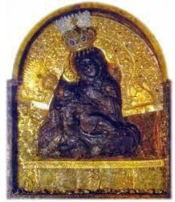
Παναγία τοῦ Μεγάλου Σπηλαίου. Ἔργον τοῦ Εὐαγγελιστοῦ Λουκά.

βέβαια)... τὴν εἰκόνα τῆς Παναγίας, ...ὅταν εἶναι καλυμμένη 100% ἀπὸ σκουλαρίκια, βραχιόλια, δακτυλίδια, πανάκριβα ρολόγια, κολιέδες... Γιατί τρέχουμε σὲ λιτανεύσεις τῶν ἀναριθμητῶν πολυωνύμων εἰκόνων τῆς Παναγίας; Στ' ἀλήθεια τὴν ρωτήσαμε ἂν τὰ θέλῃ ὅλα αὐτά;... Γιατί δὲν μᾶς ἀρκεῖ ἡ χάρις τῶν Μυστηρίων καὶ προσφεύγουμε σὲ μαγικοὺς τρόπους καὶ τύπους ἀμφισβητουμένης θρησκευτικότητας; Γιατί; Γιατί;».