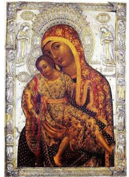
Παναγία τοῦ Κύκκου. Ἔργον τοῦ Εὐαγγελιστοῦ Λουκᾶ.

■ Ἀπαντᾶμε: Ἡ Παναγία κοιτάζει τὴν πρόθεση τοῦ προσφέροντος («ἀλάβαστρον μύρου βαρυτίμου») (Ματθ. κς' 7), καὶ ὄχι ματαιοδοξίες.