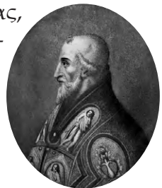
Πάπας Λέων Θ'. (1049-1054)

Αὐτὴ ἡ τραγικὴ διαστροφή τῆς ρωμαιοκαθολικῆς ἐκκλησιολογίας ἐξ αἰτίας τῆς μεταβολῆς