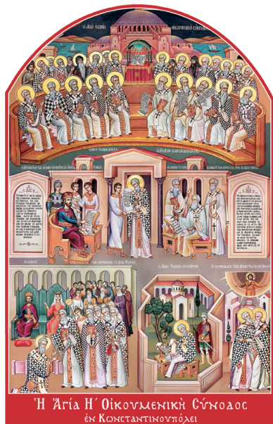
Ἡ Ἁγία Ἡ Οἰκουμενικὴ Σύνοδος ἐν Κωνσταντινουπόλει

• Ἡ μεγάλη Σύνοδος τοῦ 879 ἐν Κωνσταντινουπόλει, ἡ ὑπὸ πολλῶν θεωρουμένη ὡς Ὁγδὴ Οἰκουμενική, δεχθεῖσα τὸ Σύμβολον ἄνευ τῆς προσθήκης τοῦ Φιλιόκβε , ἔδογματίσει: “Πάντες οὕτω φρονοῦμεν, οὕτω πιστεύομεν. Τοὺς ἐτέρως πα-