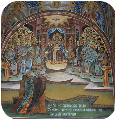
Γ΄ Οἰκουμένηκη Σύνοδος.

• Ὅπως παρατηρεῖ ὁ ἀείμνηστος ἀρχ. Σ. Μπιλάλης, «ἀντὶ