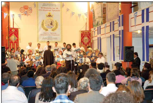
Ἑόρτιος Ἐκδήλωσις 28ης Ὀκτωβρίου εἰς Πνευματικὸν Κέντρον Ζεφυρίου Ἀττικῆς, Δῆμου Φυλῆς, 15/28.10.2013.