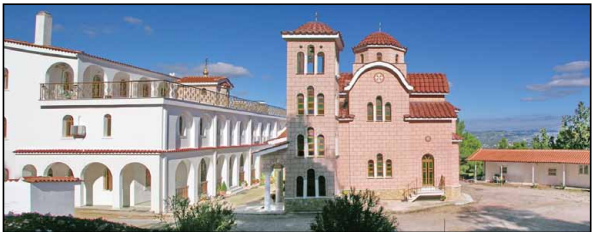
Ἱερὰ Μονὴ τῶν Ἁγίων Ἀγγέλων Ἀφιδνῶν Ἀττικῆς.