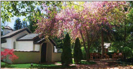
Ἱερὰ Ἀνδρῶα Μονὴ Ἁγίου Γρηγορίου Παλαμᾶ εἰς Ἔτνα Καλιφορνίας τῶν Η.Π.Α.