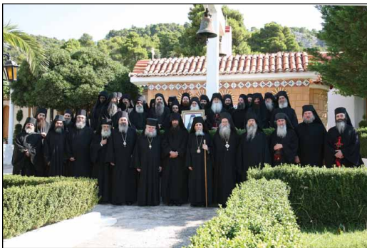
Ἡ Ἀδελφότης τῆς Ἱερᾶς Μονῆς τῶν Ἁγίων Κυπριανοῦ καὶ Ἰουστίνης Φυλῆς Ἀττικῆς, Ἰούνιος 2013.