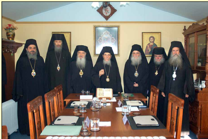
Συνεδρίασις τῆς Ἱερᾶς Συνόδου τῶν Ἐνισταμένων (Ὀκτώβριος 2013).