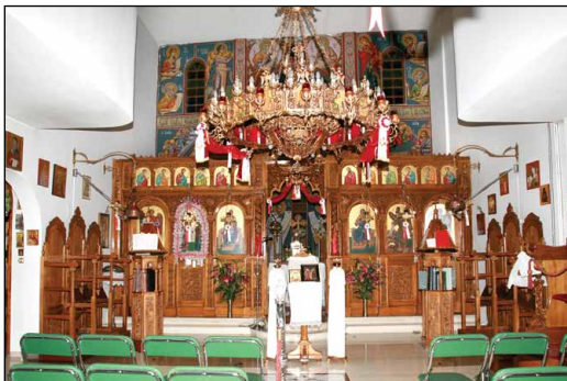
Ἱερὸς Ναὸς Ἐναγγελισμοῦ τῆς Θεοτόκου, εἰς Κολωνὸν (Πατρῶν 12) Ἀθηνῶν.