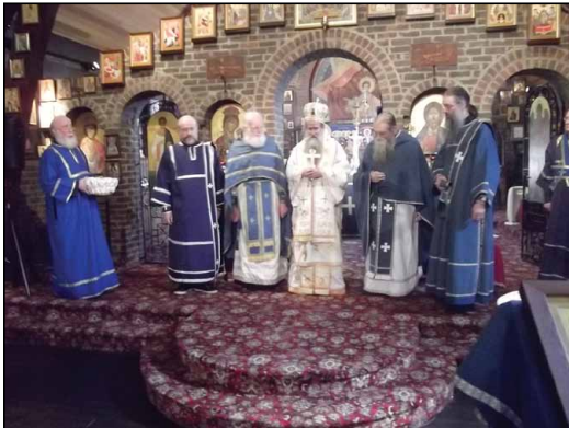
Ἱερὰ Μονὴ Ἁγίου Ἐδουάρδου Μπρόκγουιντ Ἀγγλίας.