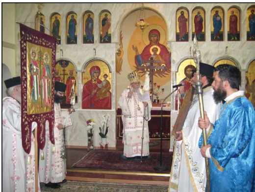
Ἱερὸς Ναὸς Ἁγίων Κωνσταντίνου καὶ Ἑλένης Στοκχόλμης.