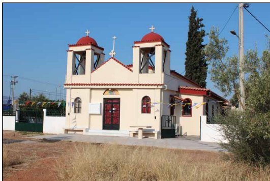
Ἱερὸς Ναὸς Ἁγίων Ἀναργύρων Ἐλευσίνος-Μάνδρας Ἀττικῆς.