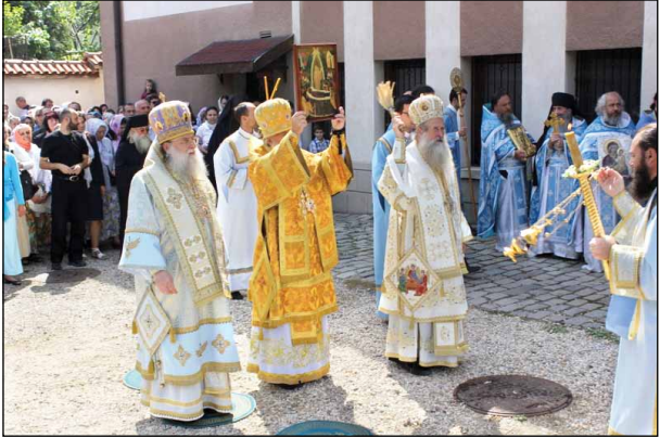
Ἀπὸ τὴν Πανήγυριν τῆς Κοιμήσεως τῆς Θεοτόκου εἰς Σόφιαν Βουλγαρίας, 15.8.2013 ἐκ.ἡμ.