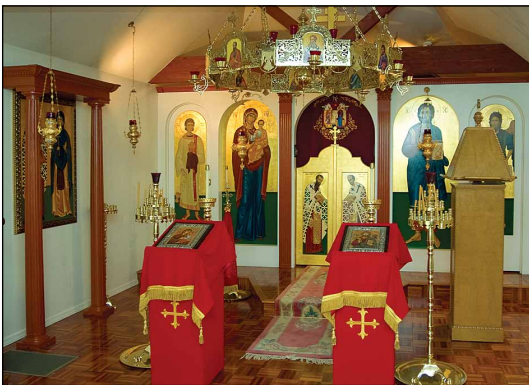
Ἱερὸς Ναὸς Ἁγίων Κυπριανοῦ καὶ Ἰουστίνης, εἰς Ἔτνα Καλιφορνίας τῶν Η.Π.Α.