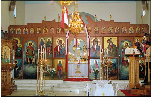
Ίερός Ναός Ἀγίων Ἀναργύρων εἰς Σύδνεϋ Ἀυστραλίας.