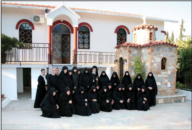
Σύναξις Μοναζουσῶν εἰς Ἱερὰν Μονὴν Ἁγίας Παρασκευῆς Ἀχαρνῶν Ἀττικῆς