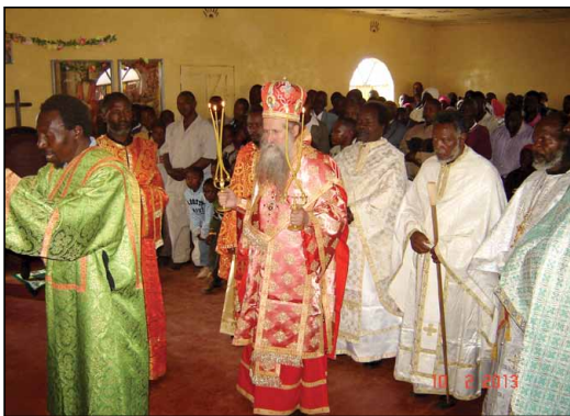
Θ. Λειτουργία εἰς Ἱερὰν Μονὴν Ἁγίου Γεωργίου Ἐμποῦ Κένυας.