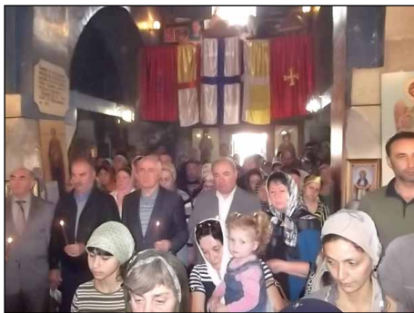
Ἐκκλησίασμα εἰς τὸν Ἱερὸν Ναὸν Γενεθλίου τῆς Θεοτόκου εἰς Τσχίνβαλ Νοτίου Ὀσσετίας.