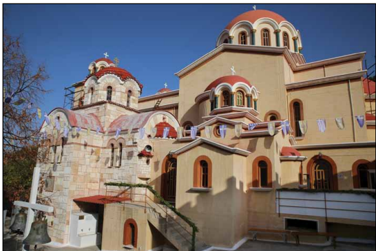
Ἱερά Μονή Ἁγίων Κυπριανοῦ καὶ Ἰουστίνης Φυλῆς Ἀττικῆς.