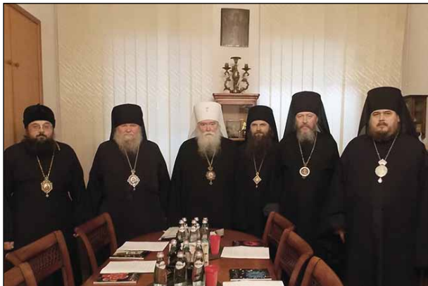
Ἡ Ἀρχιερατικὴ Ἱερὰ Σύνοδος τῆς Ρωσικῆς Ὁρθοδόξου Ἐκκλησίας ἐν Διασπορᾷ.

Ἡ ΡΟΕΔ ἀριθμεῖ περὶ τὰς ἑκατὸν (100) Ἐνορίας, μὲ ἰσαριθμούς Κληρικούς, εἰς Οὐκρανίαν, Β. καὶ Ν. Ἀμερικὴν, εἰς περιοχὰς τῆς πρώην Σοβιετικῆς Ἐνώσεως καὶ εἰς τινὰ ἄλλα μέρη τοῦ κόσμου.