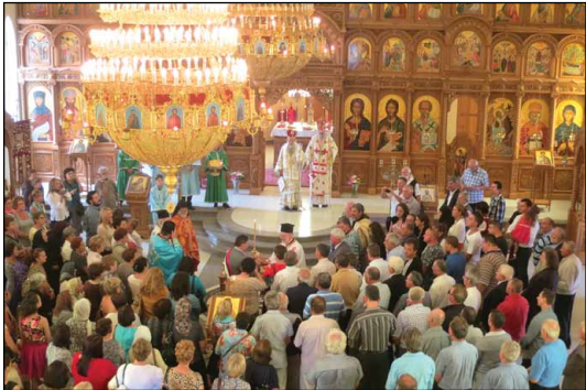
Ίερόν Προσκήνυμα Ἀγίου Σάββα Σερβίας εἰς Κανμπέρραν Ἀυστραλίας.