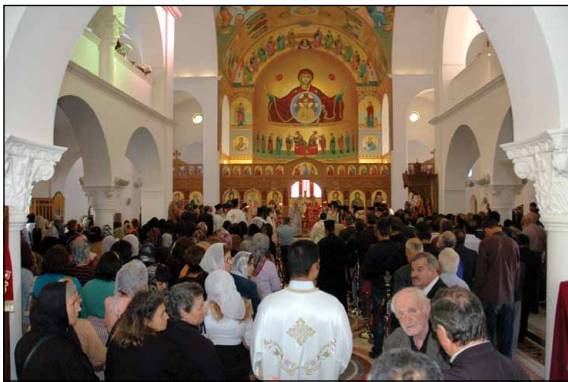
Ἐσωτερικὴ ἀπομικρὸς τοῦ Προσκυνηματικοῦ Ναοῦ τῆς Ἱερᾶς Μονῆς τῶν Ἁγίων Κυπριανοῦ καὶ Ἰουστίνης Φυλῆς.