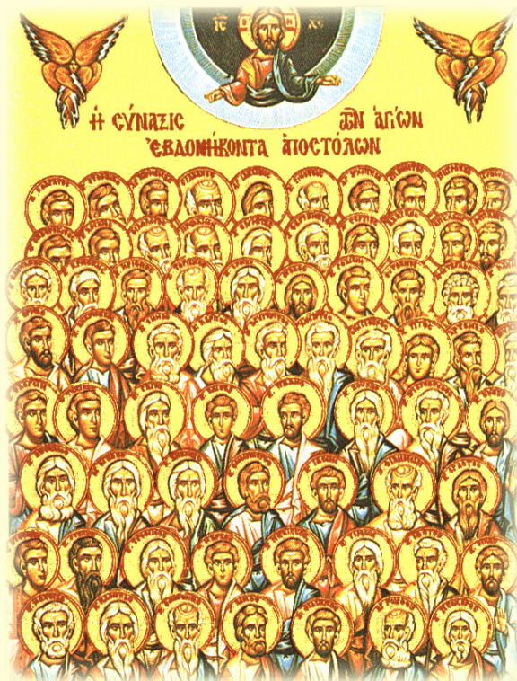
Σύναξις τῶν Ἁγίων Ἑβδομήκοντα (Ο') Ἀποστόλων