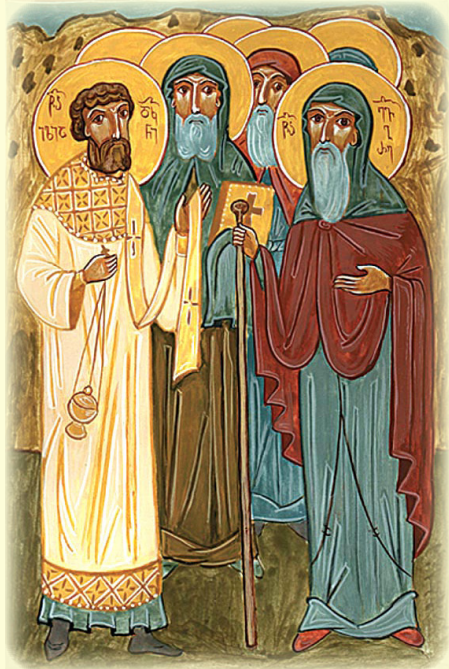
Οἱ Ἅγιοι Ὀσιομάρτυρες Εὐάγγελος, Ἡλίας ὁ Διάκονος καὶ πάντες οἱ Ὀσιο- μάρτυρες Πατέρες, οἱ ἐν τῇ Ἰ.Μ. Σιο-Μγβίμε μαρτυρήσαντες (Ἰβηρία)