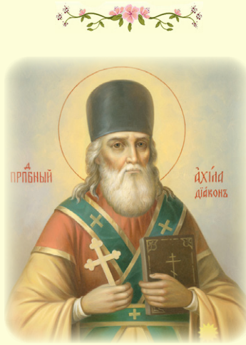
Ὁ Ὁσιος Ἀχιλλεύς, ὁ Διάκονος ἐν τῇ Ἱ. Λ. τῶν Σηλαιῶν τοῦ Κιέβου