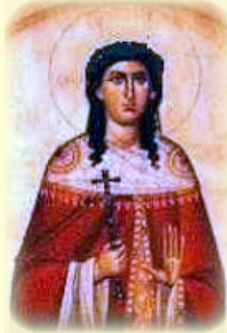
Ἡ Ἁγία Δαφρόσα, ἡ ἐν Ῥώμῃ (βλ. ἐδῶ)