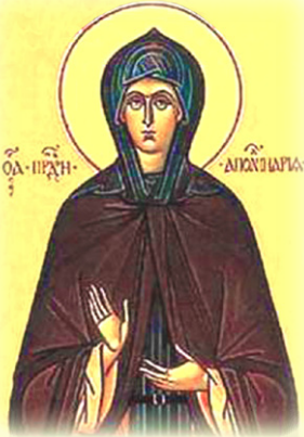
Ἡ Ὅσια Ἀπολλινάρια ἡ Συγκλητική, ἡ ἐν Αἰγύπτῳ ἀσκήσασα ὑπὸ τὸ ὄνομα Δωρόθεος