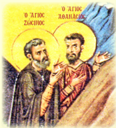
Οἱ Ἅγιοι Μάρτυρες Ζώσιμος καὶ Ἀθανάσιος ὁ Κομενταρήσιος