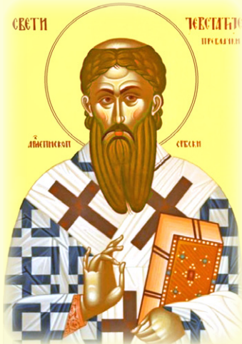
Ὁ Ἅγιος Εὐστάθιος, Ἀρχιεπίσκοπος Σερβίας