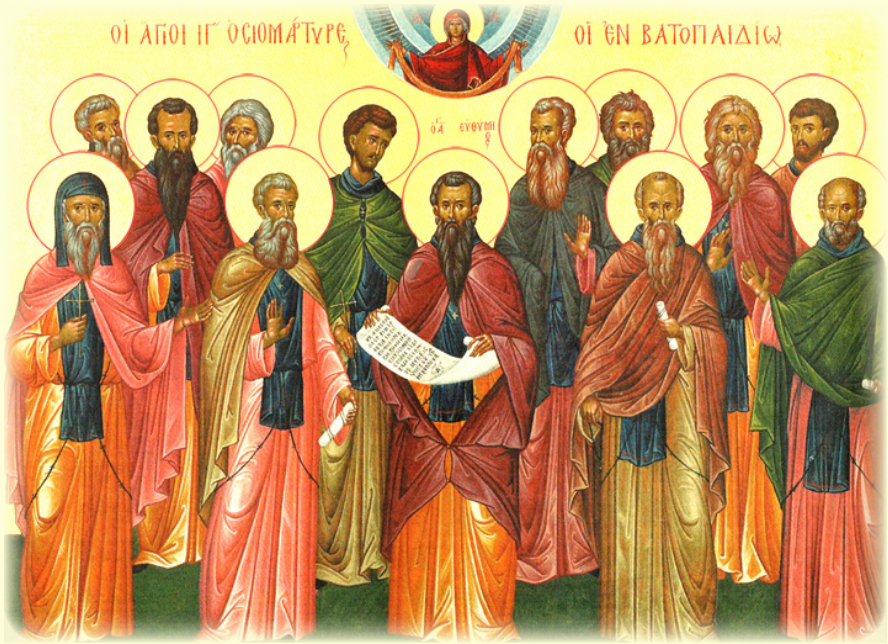
Ὁ Ἅγιος Ὁσιομάρτυς Εὐθύμιος, ὁ Βατοπαιδινὸς καὶ οἱ σὺν αὐτῷ μαρτυρήσαντες δώδεκα Μοναχοί