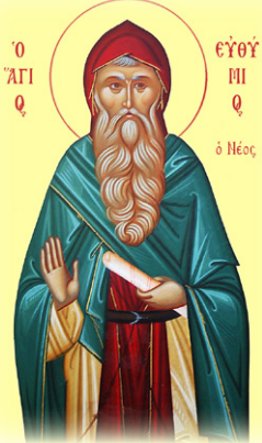
Ὁ Ὅσιος Εὐθύμιος ὁ Νεός, ὁ πλησίον τοῦ Ἁγίου Μωκίου ἐν Κων/πόλει ἀσκήσας