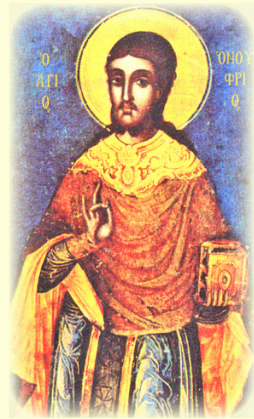
Ὁ Ἅγιος Νέος Ὁσιο- μάρτυς Ὄνουφριος, ὁ ἐκ Κάμπροβα τοῦ Τυρνάβου (Βουλγαρίας) καὶ ἐν Χίῳ μαρτυρήσας