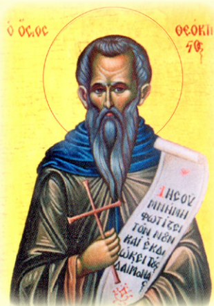
Ὁ Ὅσιος Θεόκτιστος, Ἡγούμενος τῆς Μονῆς Κουκουμίου ἐν Σικελίᾳ