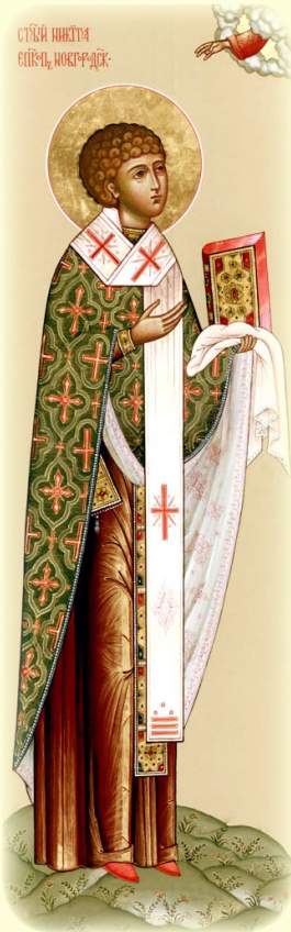
Ὁ Ὅσιος Νικήτας, Ἐπίσκοπος Νόβγκοροντ (Ρωσία)