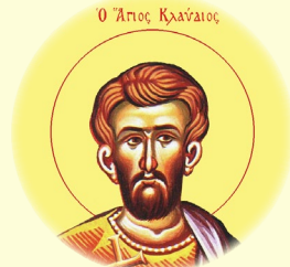
Οἱ Ἅγιοι Μάρτυρες Διόδωρος, Τρυφαῖνη καὶ Κλαύδιος