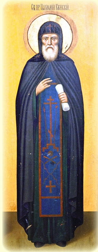
Ὁ Ὅσιος Παχώμιος, Κτήτωρ καὶ Ἡγούμενος ἐν τῇ Ἱ.Μ. παρὰ τῇ Λίμνῃ Κίνο (Κιένσκ)