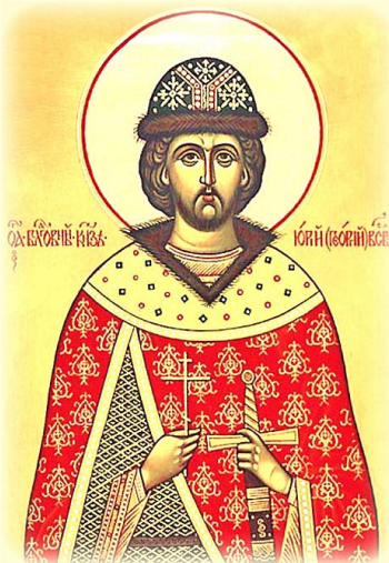
Ὁ Ἅγιος Γεώργιος τοῦ Βλαντιμίρ (Ρωσία).