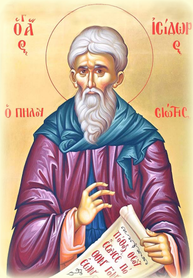
Ὁ Ἅγιος Ἰσίδωρος, ὁ Πηλουσιώτης.