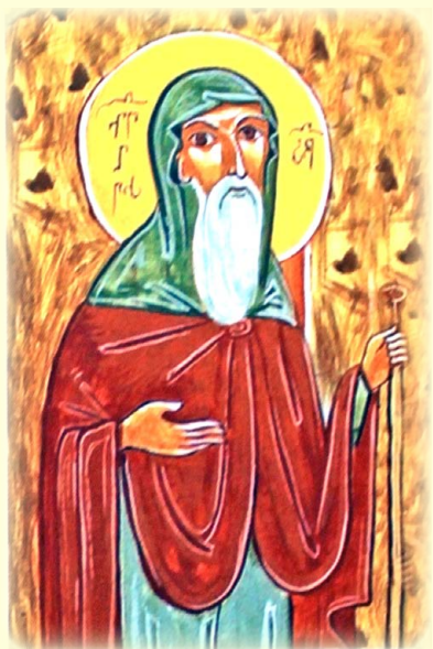
Ὁ Ἅγιος Εὐάγγελος τοῦ Μγκβιμέλι, διάδοχος τοῦ Ὁσίου Σίω (Γεωργία).