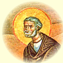
Ὁ Ἅγιος Ἱερομάρτυς Ἀβραάμ, Ἐπίσκοπος Ἀρβήλων τῆς Περσίας.