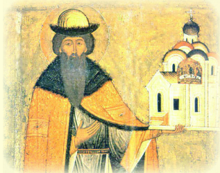
Ο Άγιος Βσέβολοντ, Ήγεμών και Πολιούχος του Πσκόφ, ό Θαυματουργός