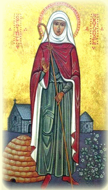
Ο Όσία Γκομπναϊτ, Ήγουμένη του Μπαλλιβούρνεϋ έν Κόρκ της Ίρλανδίας (βλ. εδώ )