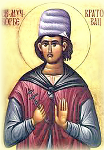
Ο Άγιος Νεομάρτυς Γεώργιος, ό Σέρβος, ό εκ Κράτοβο της Σερβίας και έν Σόφια της Βουλγαρίας μαρτυρήσας