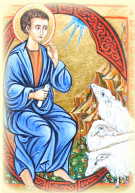
Ο Άγιος Κεϊντμοντ του Ουΐτμπι (Βόρεια Άγγλια)