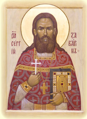
Ὁ Ἅγιος Νεὸς Ἱερομάρτυς Σέργιος (Ζαβάρην) ἐκ Ρωσίας.