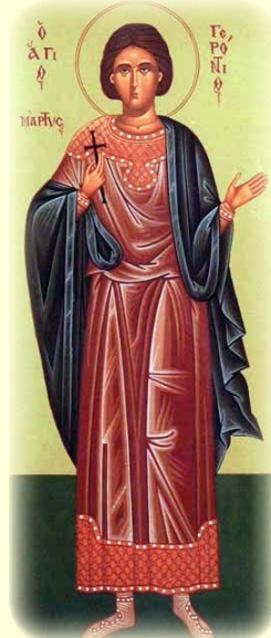
Ὁ Ἅγιος Μάρτυς Γερόντιος.