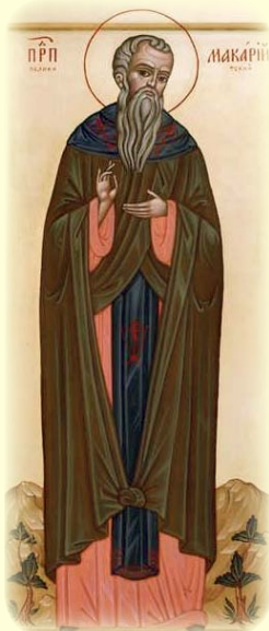
Ὁ Ὅσιος Μακάριος ὁ Ὁμολογητὴς, Ἡγούμενος Κανονάρχης τῆς Ἱ.Λ. τῶν τῆς Ἱ. Μ. Πελεκητῆς.