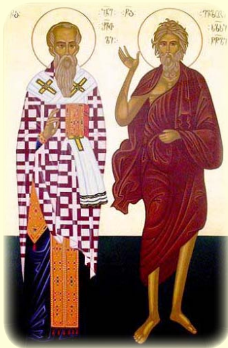
Οἱ Ὅσιοι Ἰωάννης, ὁ Φιλόσοφος καὶ Εὐ- λόγιος, ὁ διὰ Χριστὸν Σαλός, ἐκ Γεωργίας.