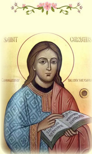
Ὁ Ὅσιος Γερόντιος, ὁ Σπηλαιῶν τοῦ Κιέβου.