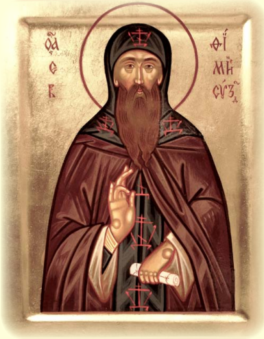
Ὁ Ὅσιος Εὐθύμιος, ὁ ἐκ Σουζδαλίας (Ρωσία).