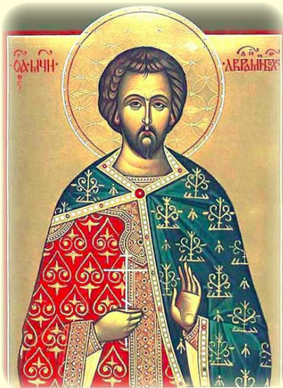
Ὁ Ἅγιος Νεομάρτυς Ἀβράμιος, ἐκ Βουλγαρίας.