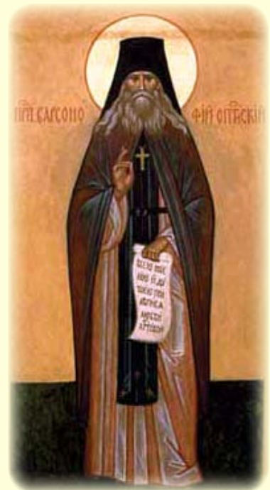
Ὁ Ὅσιος Βαρσανούφιος τῆς Ὀπτίνα (Ρωσία, βλ. ἐδῶ ).