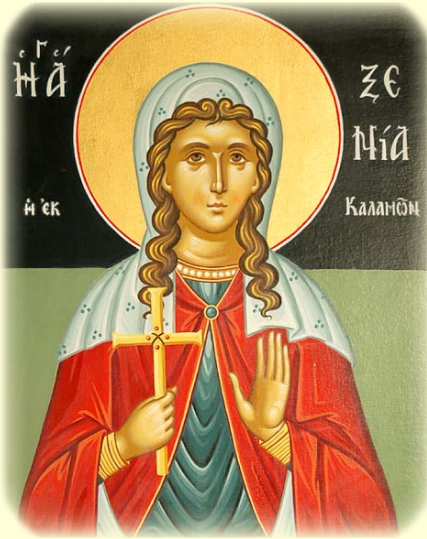
Ἡ Ἁγία Μεγαλομάρτυς Ξενία ἡ Θαυματουργὸς ἐν Καλάμαις τῆς Πελοποννήσου