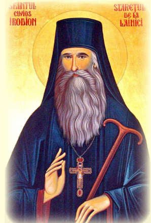
Ὁ Ἅγιος Μαμαΐ, Καθολικός τῆς Γεωργίας, οἱ Ἅγιοι Μιχαὴλ καὶ Ἀρσένιος ἐν Οὐλούμπα (Γεωργία), καὶ Ὁ Ἅγιος Ἡρωδίων, Ἡγούμενος τῆς Μονῆς Λαϊνίτσι (Ρουμανία)