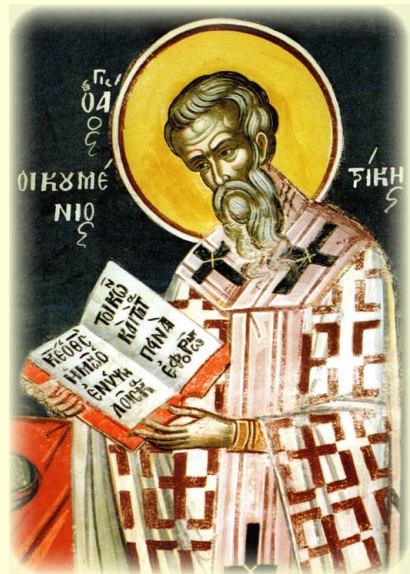
Ὁ Ἅγιος Οἰκουμένιος, Ἐπίσκοπος Τρίκκης, ὁ Θαυματουργός