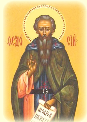
Ὁ Ὁσιος Θεοδοσίος, Ἡγούμενος τῆς Ἱ.Λ. τῶν Σηπλαιῶν τοῦ Κιέβου καὶ θεμελιωτῆς τοῦ Κοι- νοβιακοῦ Βίου ἐν Ρωσίᾳ