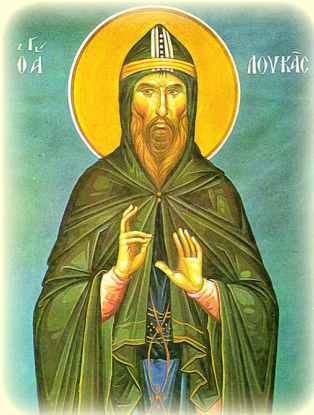
Ἀνακομιδὴ τοῦ τιμίου Λειψάνου τοῦ Ὁσίου Λουκᾶ τοῦ ἐν τῷ Στεριῶ