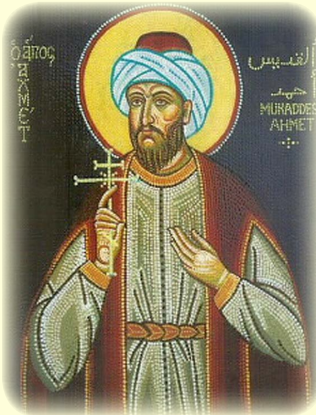
Ὁ Ἅγιος Νεομάρτυς Ἀχμετ ὁ Καλλιγράφος, ὁ καὶ Κάλφας καλούμενος